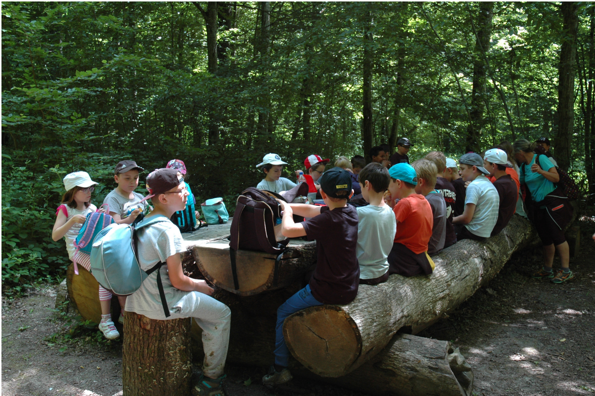
Table de pique-nique, © Marie-Céline Henry