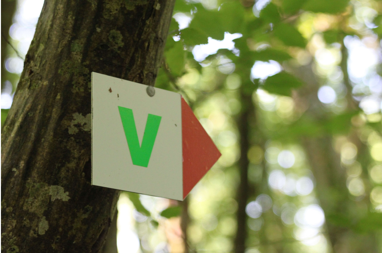
Balisage sur les sentiers de Vent des Forêts

Vent des Forêts propose 7 circuits balisés, représentés par 7 couleurs différentes. Pendant la balade, ces couleurs sont visibles via des balisages réguliers vous permettant de confirmer que vous êtes sur le bon circuit.