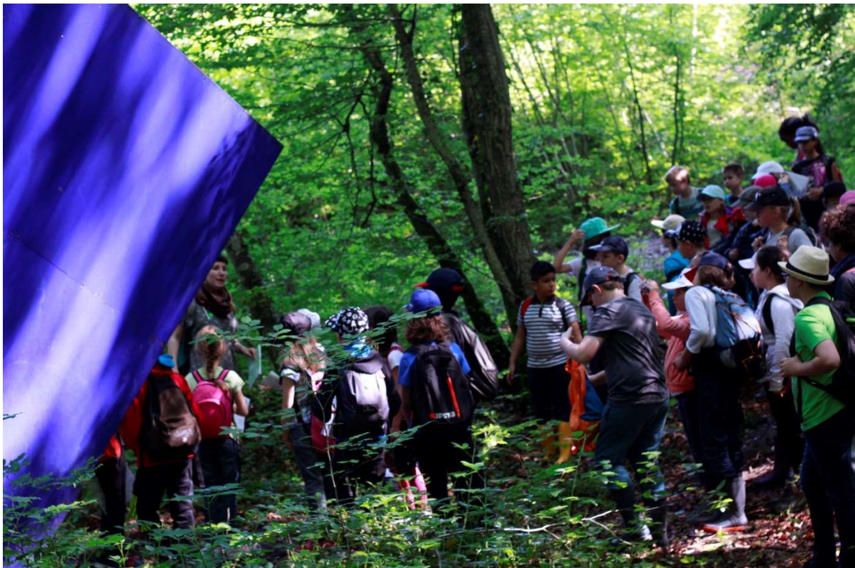
2016, visite d'un groupe scolaire sur le circuit des Trois fontaines, © Roxane Kouby

(Dernière mise à jour, le 2 septembre 2020)